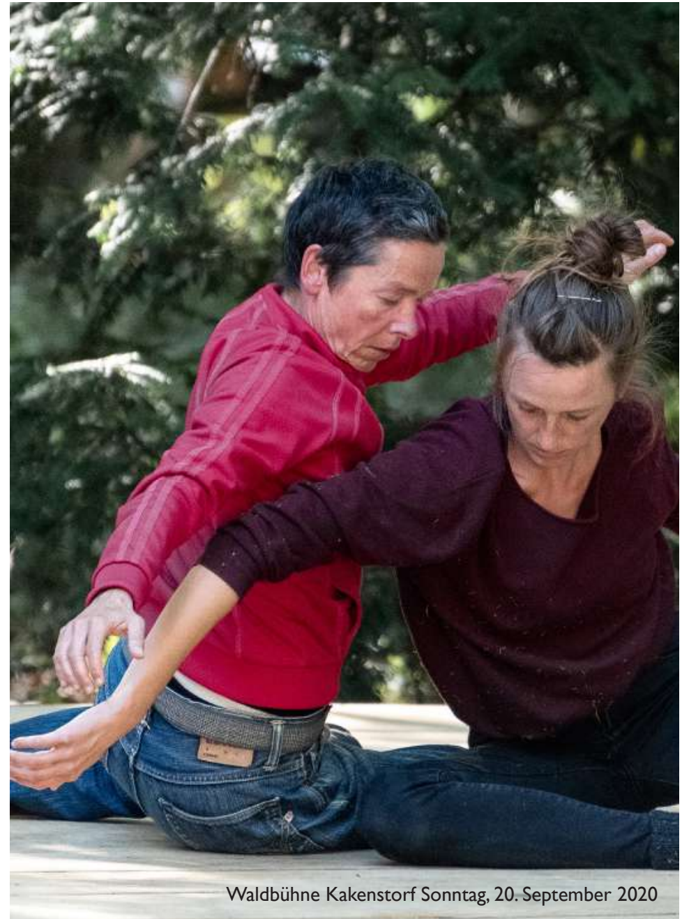
Waldbühne Kakenstorf Sonntag, 20. September 2020

Jede*r ist aufgefordert, für sich selbst die Verantwortung zu übernehmen und achtsam mit sich und dem anderen zu sein: ‚Alles kann, nichts muss‘.