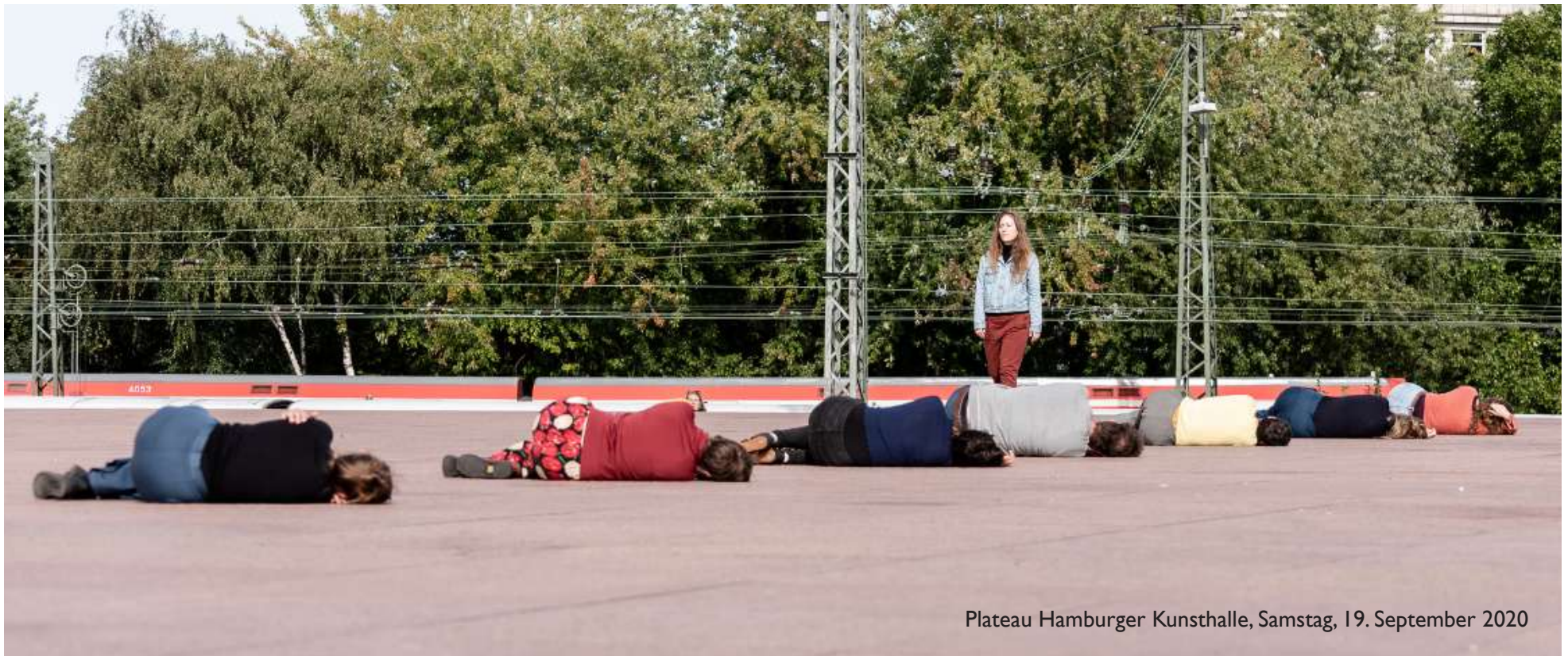
Plateau Hamburger Kunsthalle, Samstag, 19. September 2020

Wie geht es uns damit? Wie viel Nähe und Nicht-Nähe ist da? Wie viel Nähe, Nicht-Nähe und Wärme braucht und verträgt ‚zwischenmenschliches‘ Klima und Miteinander? In einer Körperinstallation forschen wir zu diesen aktuell bewegenden Fragen.